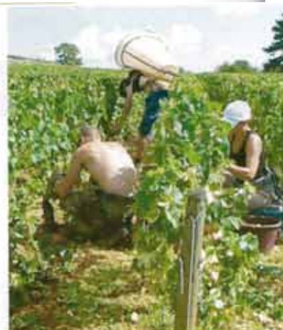
Vendanges 2015 au Domaine Jean Chartron