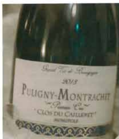
Le Clos du Cailleret du Domaine Jean Chartron